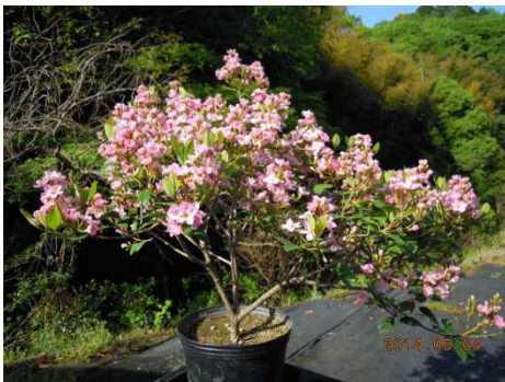
2014年5月4日撮影（圃場の大株）

圃場で管理している大株も樹高約60cm 樹幅約80cmで、剪定は行っていない。分枝が旺盛なため、枝葉も非常に密になっている。また、親品種（従来品種）では困難だった露地栽培が可能になるほどの耐病性があるため、消毒が少なく済んでいる。