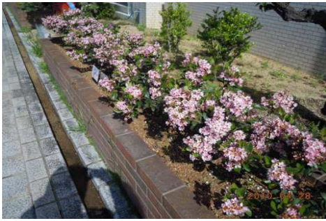
和歌山県振興局エントランス