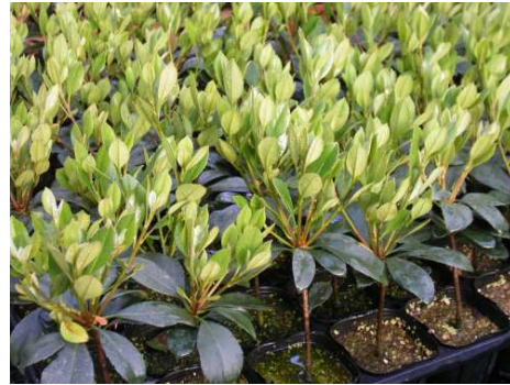
ペリドットの新芽

ペリドット(peridot、ペリドートとも)とは宝石の一種である。カンラン石(苦土カンラン石)の変種。屈折率が高いため、 明るい緑色が映える ことが特徴の宝石である。ローマ人はその石が夜暗くなってもまだ見ることができ色が暗くならなかったので、「イブニングエメラルド」と呼んだ。後にペリドットは十字軍によって持ち帰られ、中世の教会の装飾に使われた。200カラット以上ある大きなペリドットが、ケルン大聖堂にある東方の三博士の3つの聖堂を飾っている。