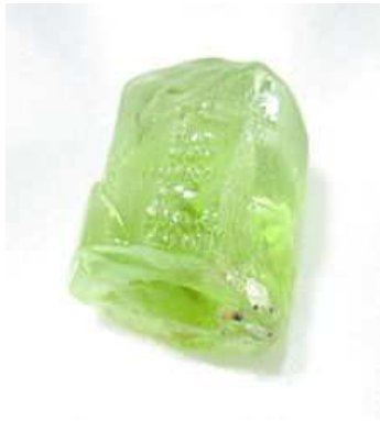
ペリドットの原石